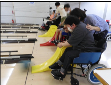
↑グランドボウルにて↓